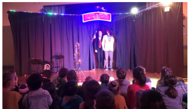
Foyer Rural de Brécy : Photos de la marche nocturne organisée pour le Téléthon et de la fête de Noël.